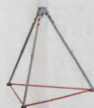
2,50 m med bærerem