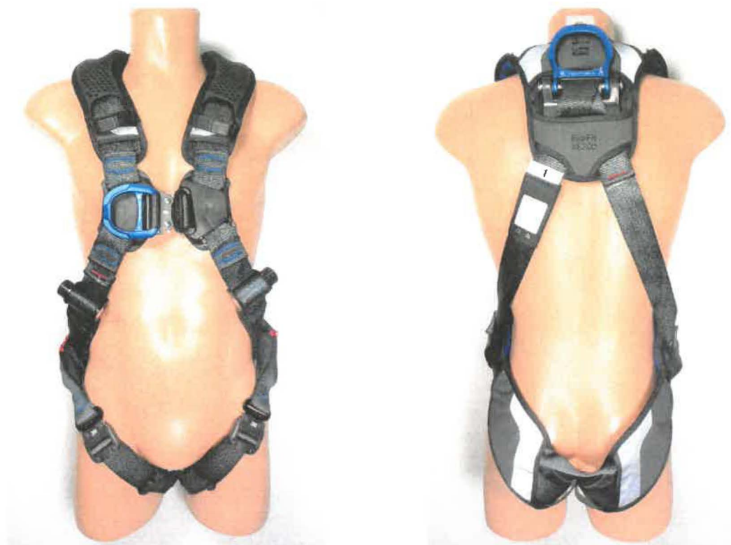
"Harness without belt 1112726"