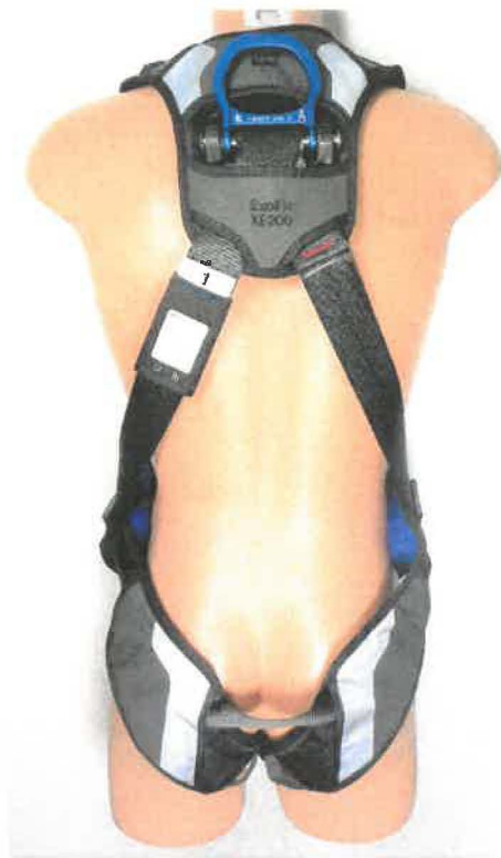
"Harness without belt and with rescue loops 1112732"