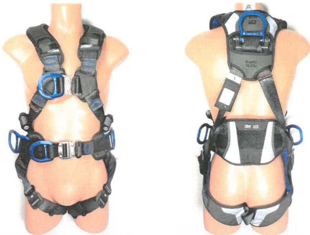
"Harness with belt and front positioning D-ring 1112738"