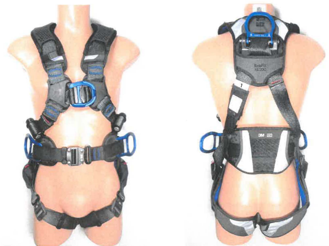
"Harness with belt 1112729"