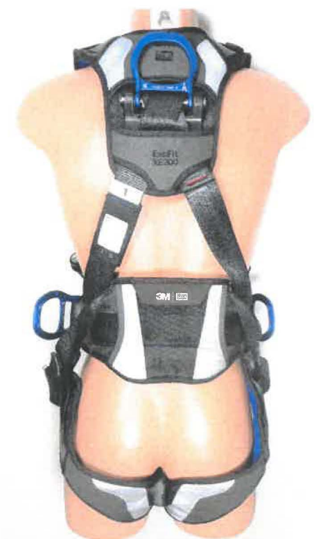
"Harness with belt and with rescue loops 1112735"