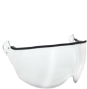
WVI00018 V2 PLUS VISIR